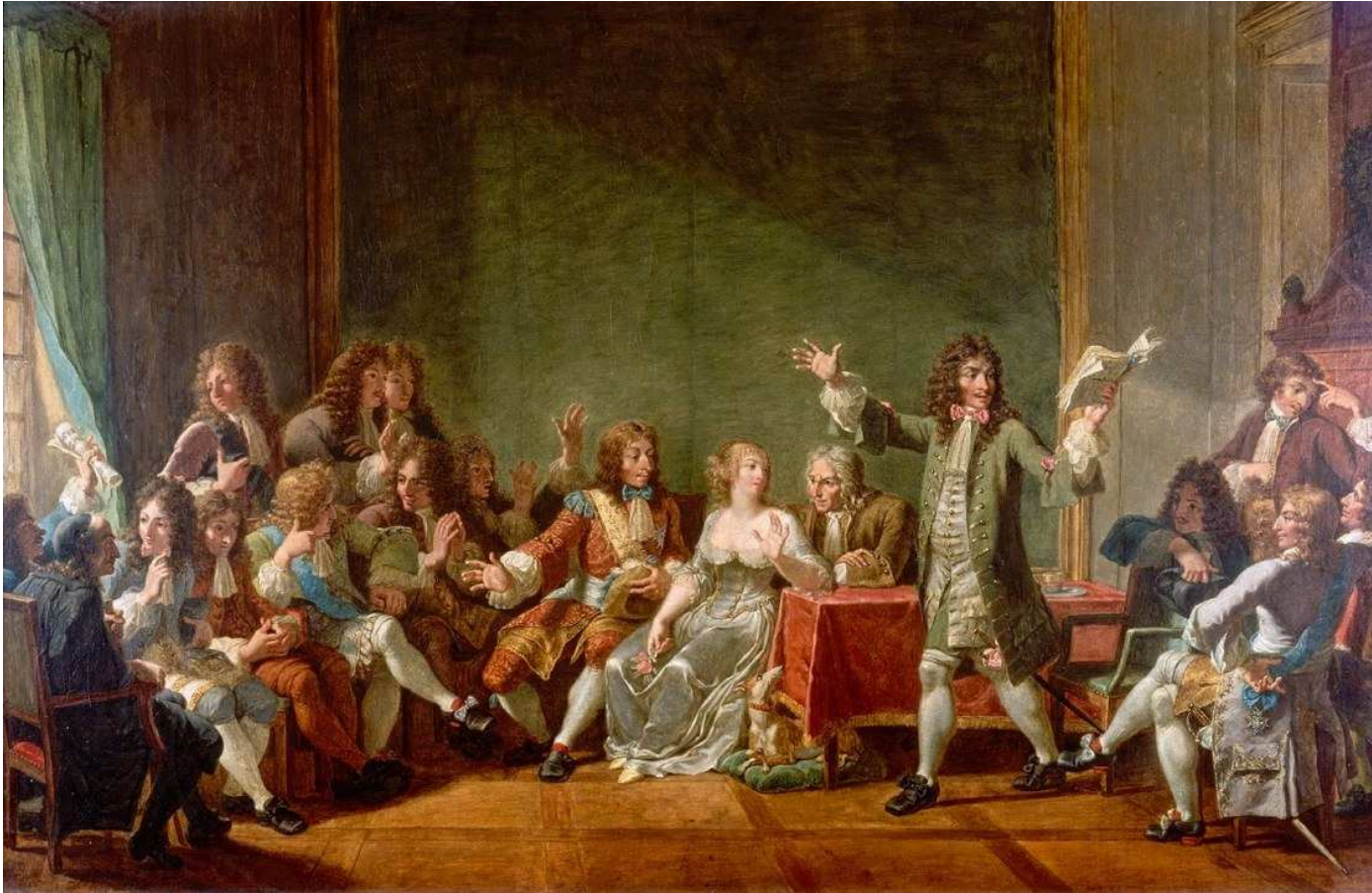
MOLIÈRE LISANT TARTUFFE CHEZ NINON DE LENCLOS.

MONSIAU Nicolas André (1754 - 1837)