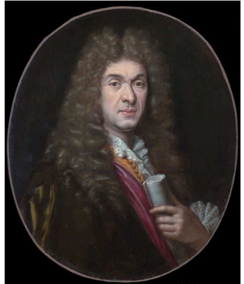
PORTRAIT DE LULLY