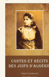
Contes et récits des Juifs d'Algérie, Simon Darmon, Éditions ESDÉ - A.I.T.A..