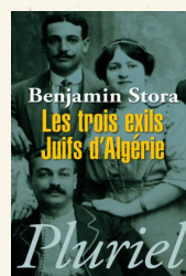
Les trois exils, Juifs d'Algérie, Benjamin Stora, Hachette Pluriel