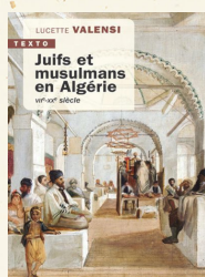
Juifs et musulmans en Algérie, Lucette Valensi, Éditions Taillandier