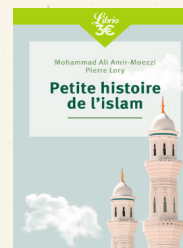
Petite histoire de l'islam, Amir-Moezzi Mohammad Ali, Lory Pierre, J'ai lu Éditions