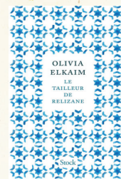
Le tailleur de Relizane , Olivia Elkaim, éditions Stock