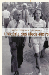
L'Algérie des Pieds-Noirs, Entre l'Espagne et la France , Anne Dulphy, éditions Vendémiaire