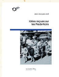
Idées reçues sur les Pieds-Noirs , Jean-Jacques Jordi, éditions Cavalier bleu