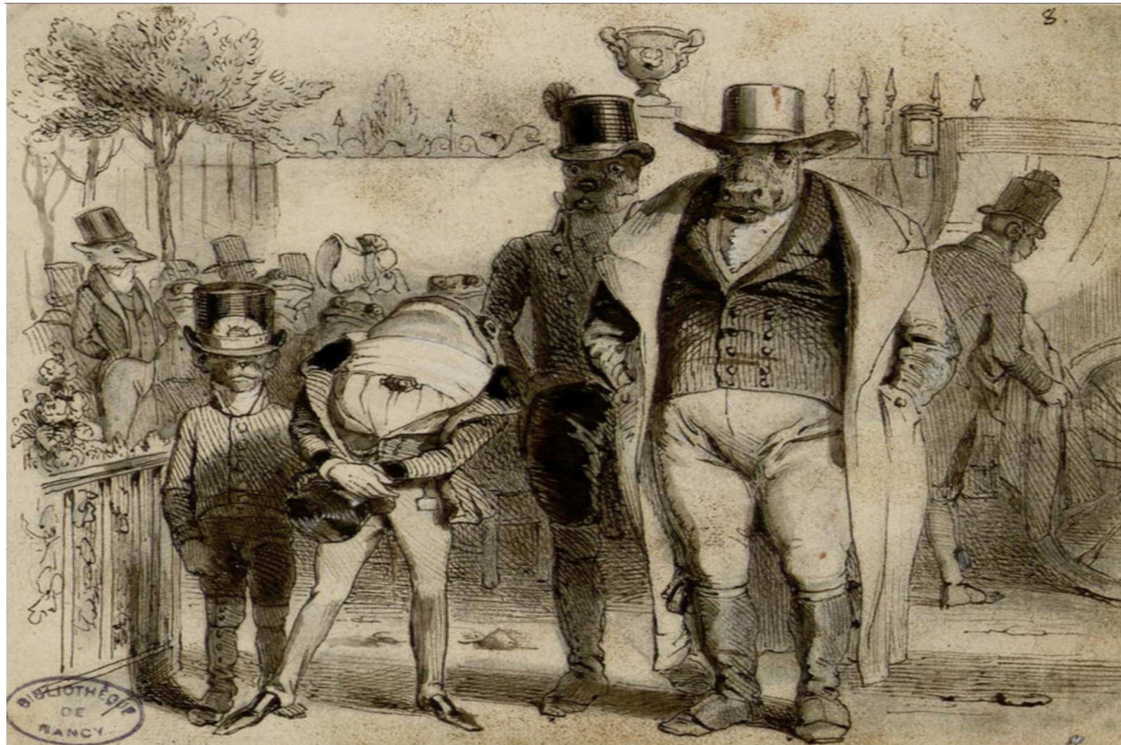
[Tome I. Livre I. Fig. de la Fable III :] La grenouille qui se veut faire aussi grosse que le boeuf. [cote : microfilms R 122465-468]