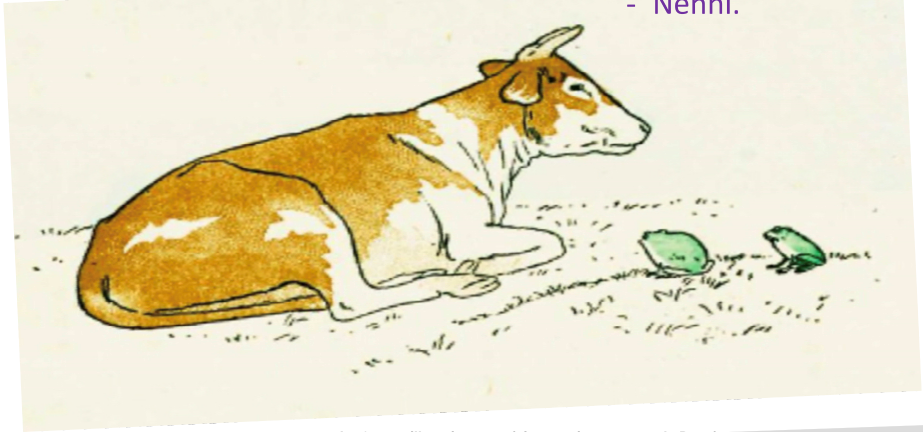
La Grenouille qui veut se faire aussi grosse que le Bœuf

« Regardez bien, ma sœur ; Est-ce assez ? Dites-moi ; n'y suis-je point encore ? - Nenni.