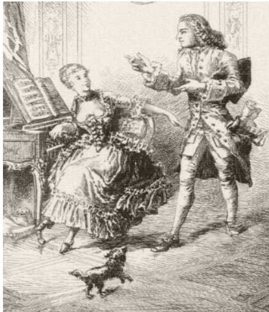
Le neveu de Rameau donnant une leçon de clavecin

Gautier Saint Elme (1849-18..), graveur, 1883. Estampe