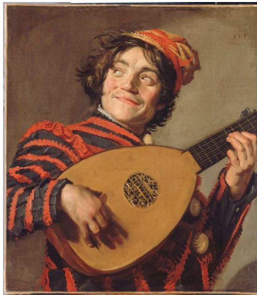
Le Bouffon au luth , Frans Hals