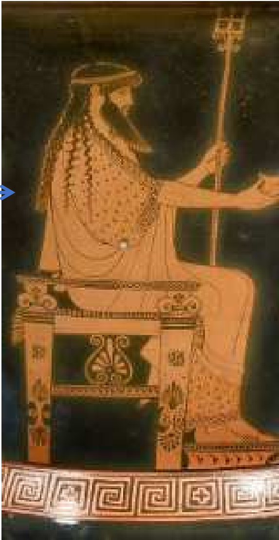
Poséidon et Thésée