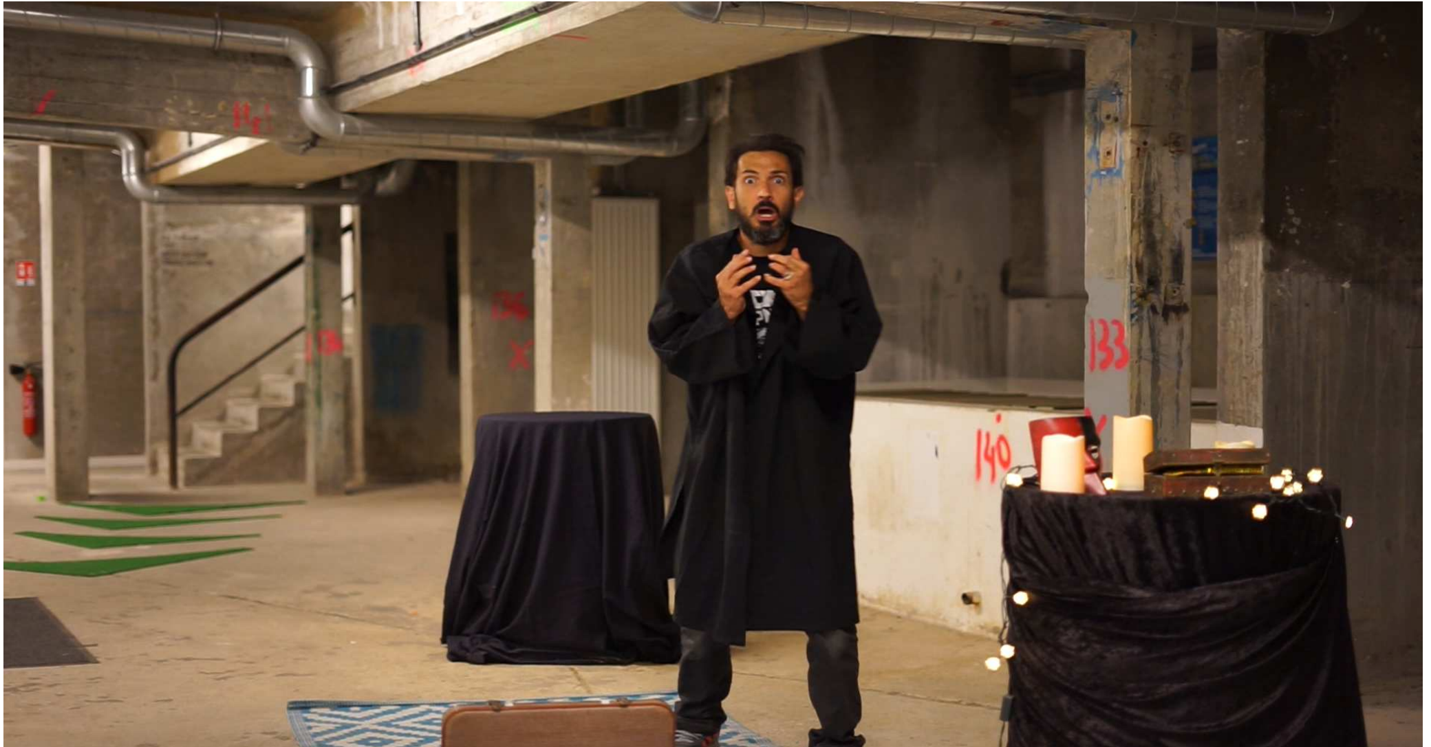
Compagnie Latinomania