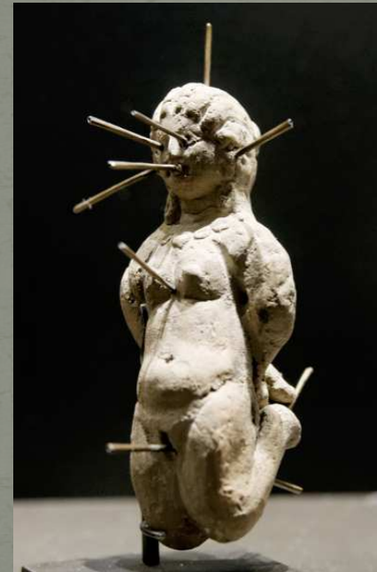
Amulette de défexion et aiguilles, Figurine de Ptolémaïs, Musée du Louvre, Paris